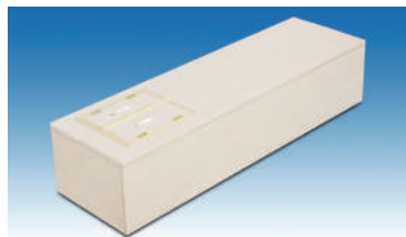
桐プリント棺 (内装・仏衣一式)