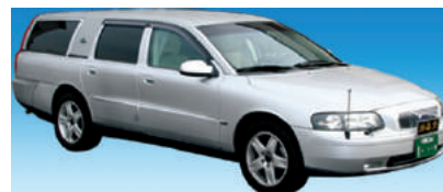
洋型霊柩車 (外国産高級車仕様)