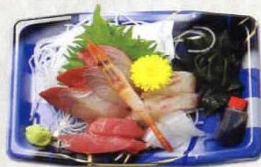
刺身 540円 〔税込〕