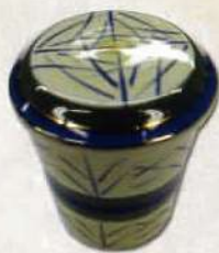
茶碗蒸し 378円 〔税込〕