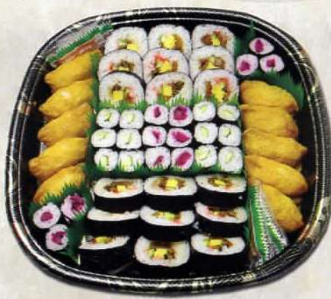
寿司盛り 3.240円 〔税込〕