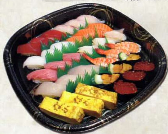
にぎり寿司盛り合わせ 3～5人前 5.400円 〔税込〕