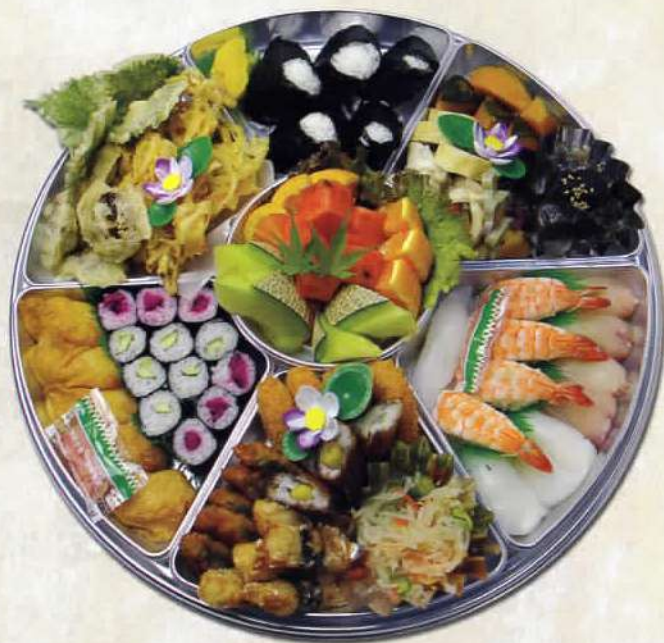
寿司・むすび入りオードブル 6人前 10.800円 〔税込〕