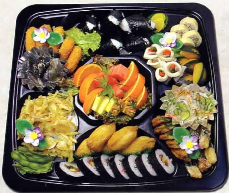
寿司・むすび入りオードブル 5人前 7.560円 〔税込〕