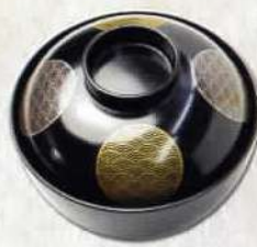
吸物 270円 〔税込〕