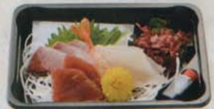
刺身 560円 税込