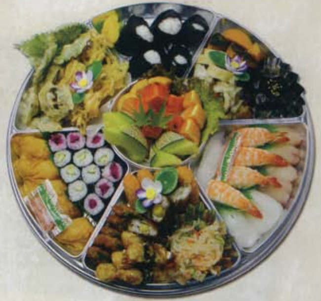
寿司・むすび入りオードブル 6人前 12,000円 税込