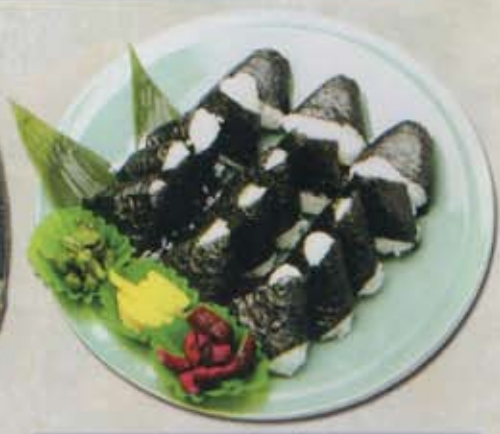
おむすび 2,300円 税込