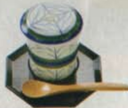
茶碗蒸し 380円 税込