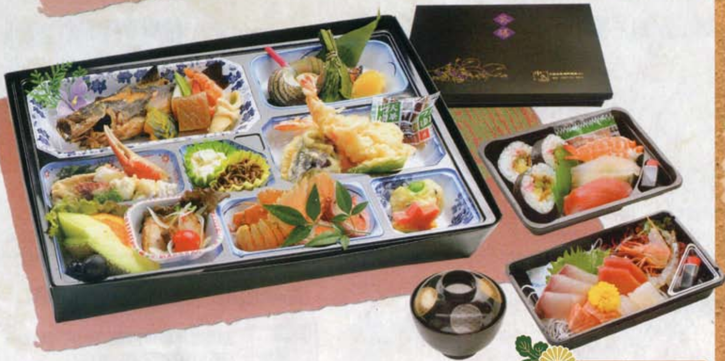
パック会席膳 6,800円 税込