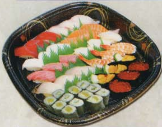
にぎり寿司盛り合わせ 3~5人前 5,700円 税込