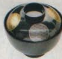
吸物 280円 税込