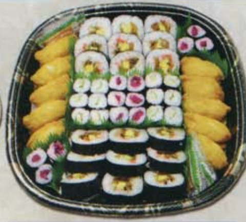
寿司盛り 3,400円 税込