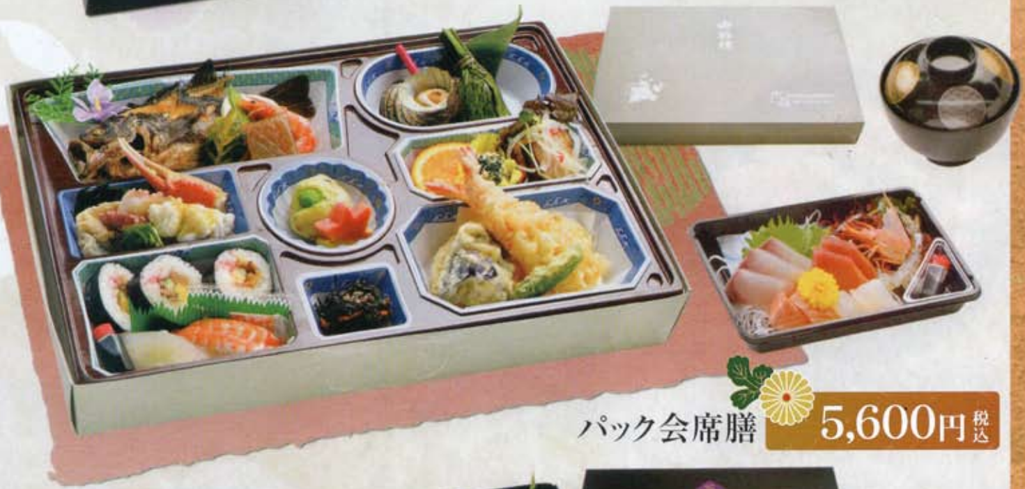
パック会席膳 5,600円 税込