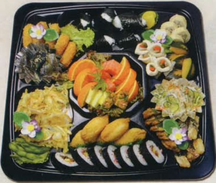
寿司・むすび入りオードブル 5人前 7,800円 税込