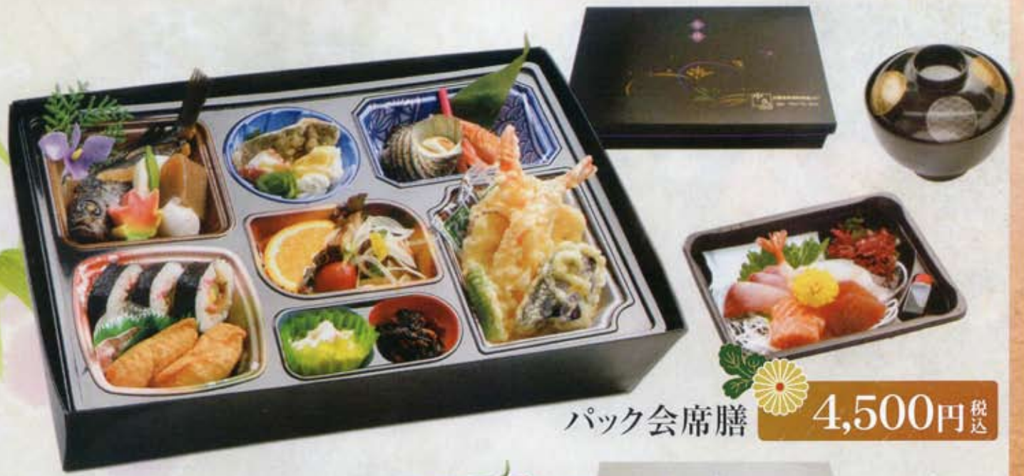
パック会席膳 4,500円 税込